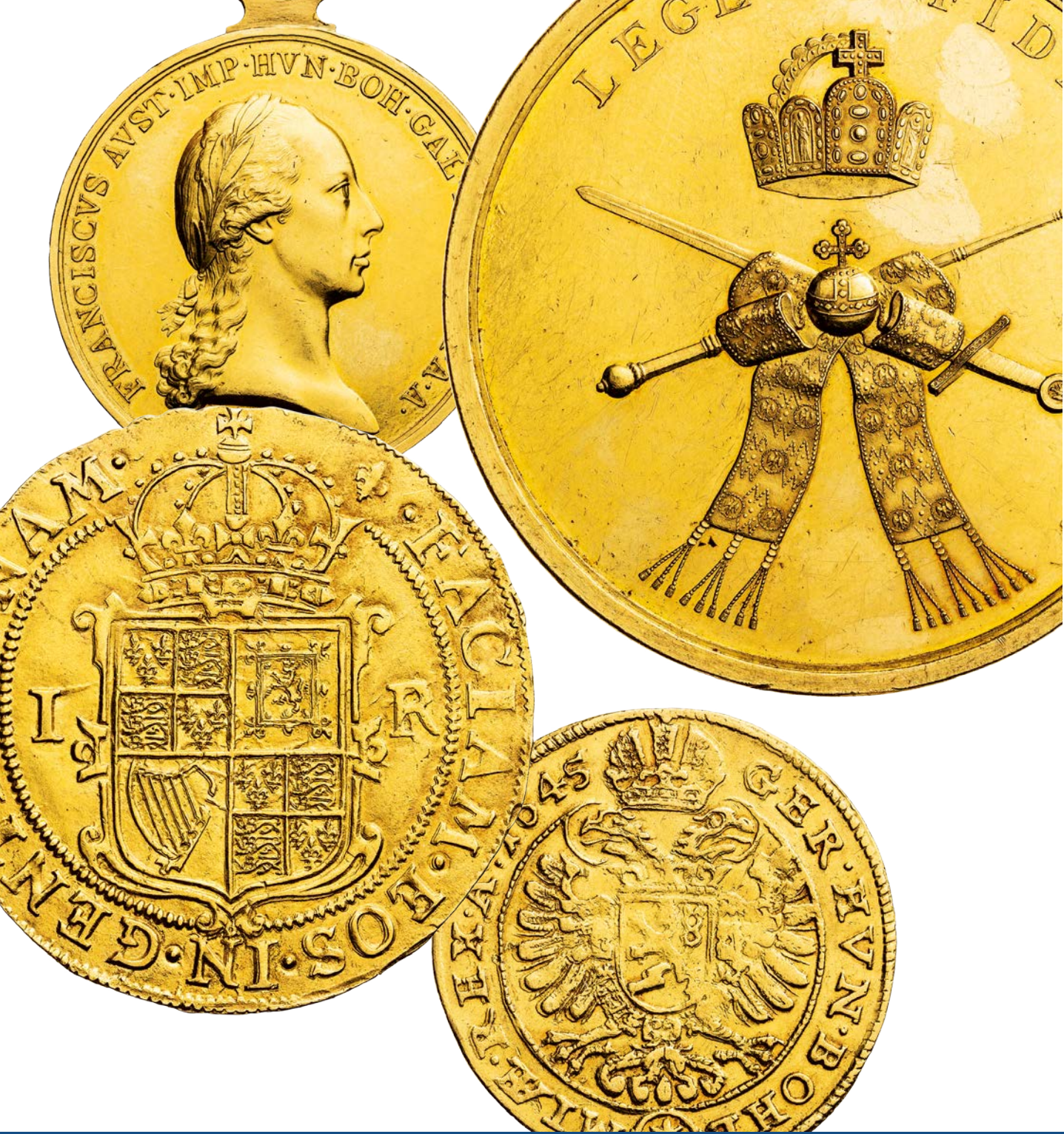
FOTO A DESIGN OBÁLKY: ABALON S.R.O. SAZBA: MILOSLAV VYMAZAL TISK: EUROPRINTY, SPOL. S R.O., BŘECLAV